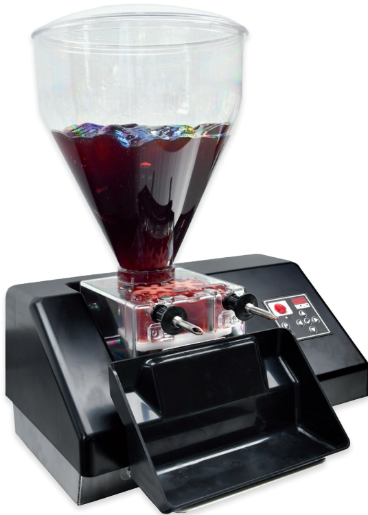
Code: FG053-A21 (unité de base)

La solution parfaite pour tous vos besoins d'injection