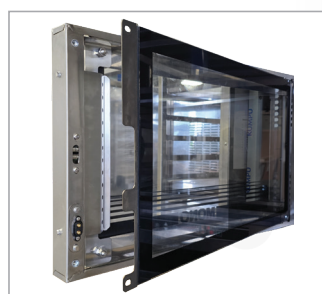
Panneau intérieur articulé pour un nettoyage facile

Comme présenté dans l'espace boulangerie - de MONO - L'unité autonome de boulangerie et de merchandising