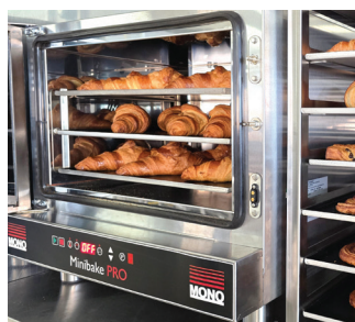
Four à convection MONO Minibake Pro